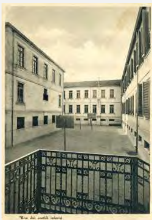
Una dei cortili interni